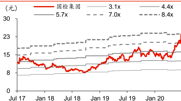
图表3：国检集团历史 PB-Bands